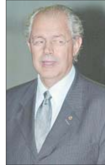
HAULY: TUCANO PRESIDIRÁ GRUPO DE TRABALHO PARA REDIGIR PROPOSTA

O Correio procurou medir a aceitação das idéias que substanciam a nova reforma sondando integrantes da Comissão Técnica Permanente do ICMS (Cotepe). Subordinada ao Conselho Nacional de Política Fazendária (Confaz), essa comissão é formada por técnicos das receitas estaduais, que costumam atuar como conselheiros dos secretários de Fazenda. Isto é, detêm as idéias que em última instância moldarão a opinião dos governadores.